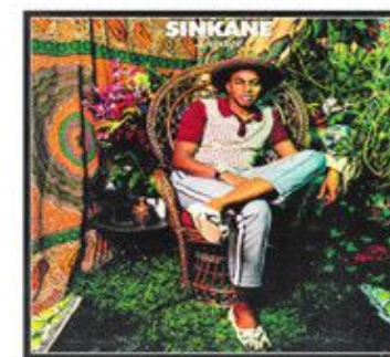
afro/funk SINKANE Depayse City Slang ★★★★

Santana je Rubinu rekao da zna što je i kako radio s Cashom, Peppersima, Metallicom i drugima, a na Rubinovo pitanje što onda želi od njega, rekao da ga zanima samo "afrička glazba". Instantno su kliknuli jer u deset dana snimili su čak 49 skladbi pa je prilično izvjesno da će "Africa Speaks" dobiti jedan ili više nastavaka. No nije taj album samo "afrička glazba" nego i njena fascinantna fuzija s blaxploitation funkom te blues, jazz, psihodeličnim i latin-rockom. Prava oluja udaraljki, orgulja i afrikaniziranih napjeva ponad kojih se razvijaju uraganski uleti Santanine gitare. ☺